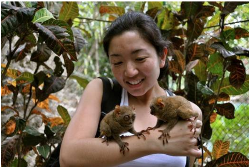
Cuddling Tarsius in Bohol

Konsultieren Sie die offizielle Website des Department of Tourism ». Weitere Reise- und touristische Informationen bieten Lonely Planet » sowie der Philippines Travel Guide ».